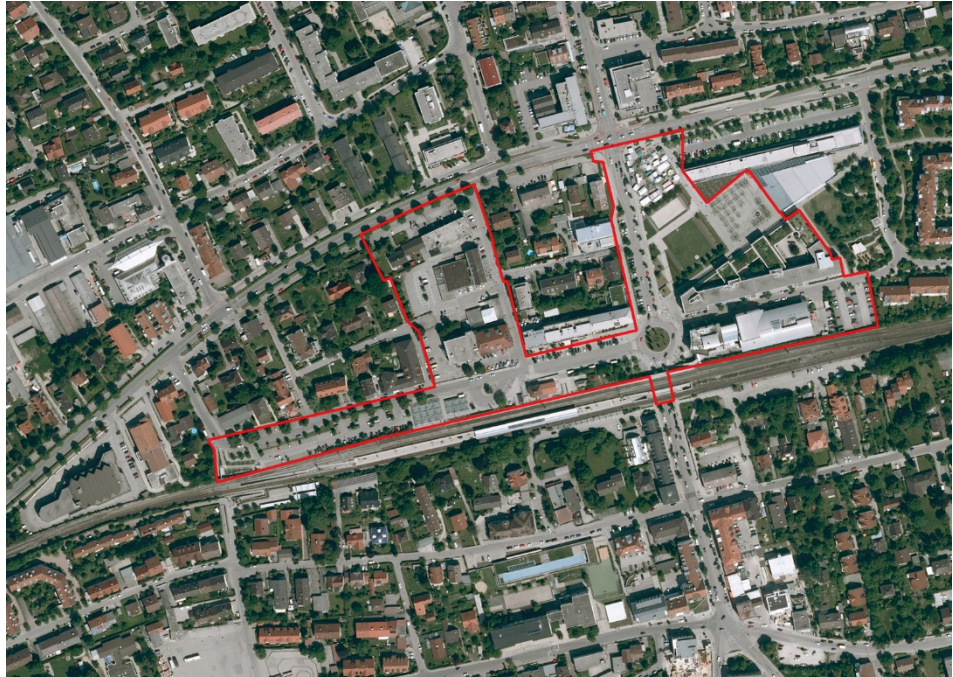
Luftbild mit Wettbewerbsumgriff